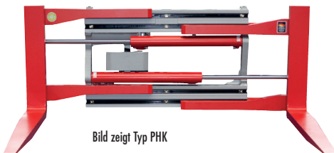
Bild zeigt Typ PHK